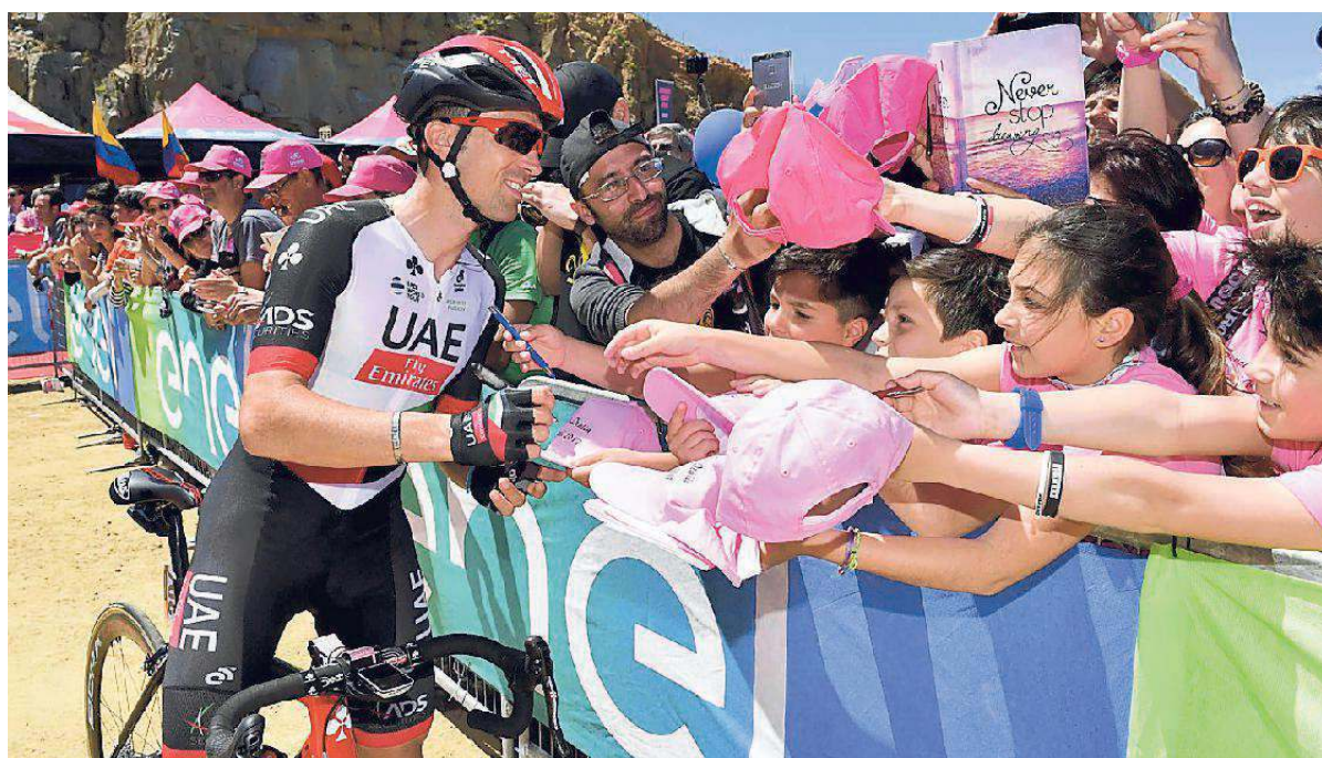
Il Giro d'Italia una importante vetrina per la Sardegna, ora si aspettano le ricadute

INVESTITI 4,4 MILIONI PER LA CORSA ROSA: L'EFFETTO MOLTIPLICATORE