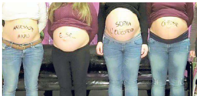
La recente protesta delle "pance" delle mamme della Maddalena